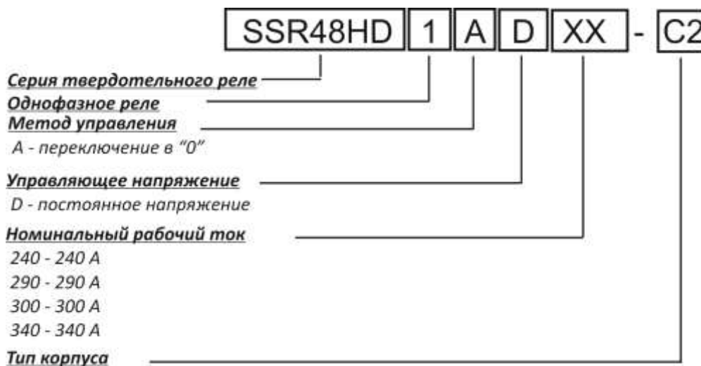
Рисунок 1 – Код заказа