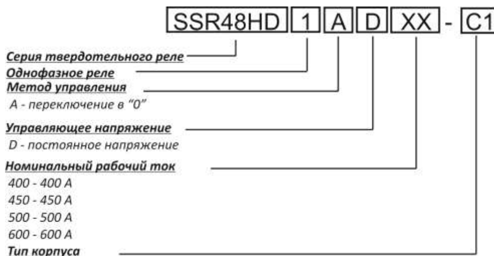
Рисунок 1 – Код заказа